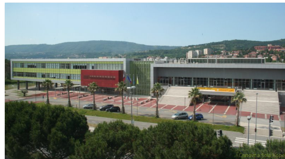
Osnovna šola Koper