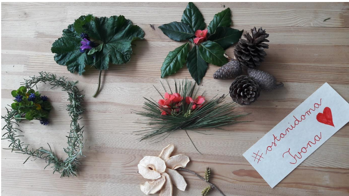
IVONA PALČIČ, 2. a