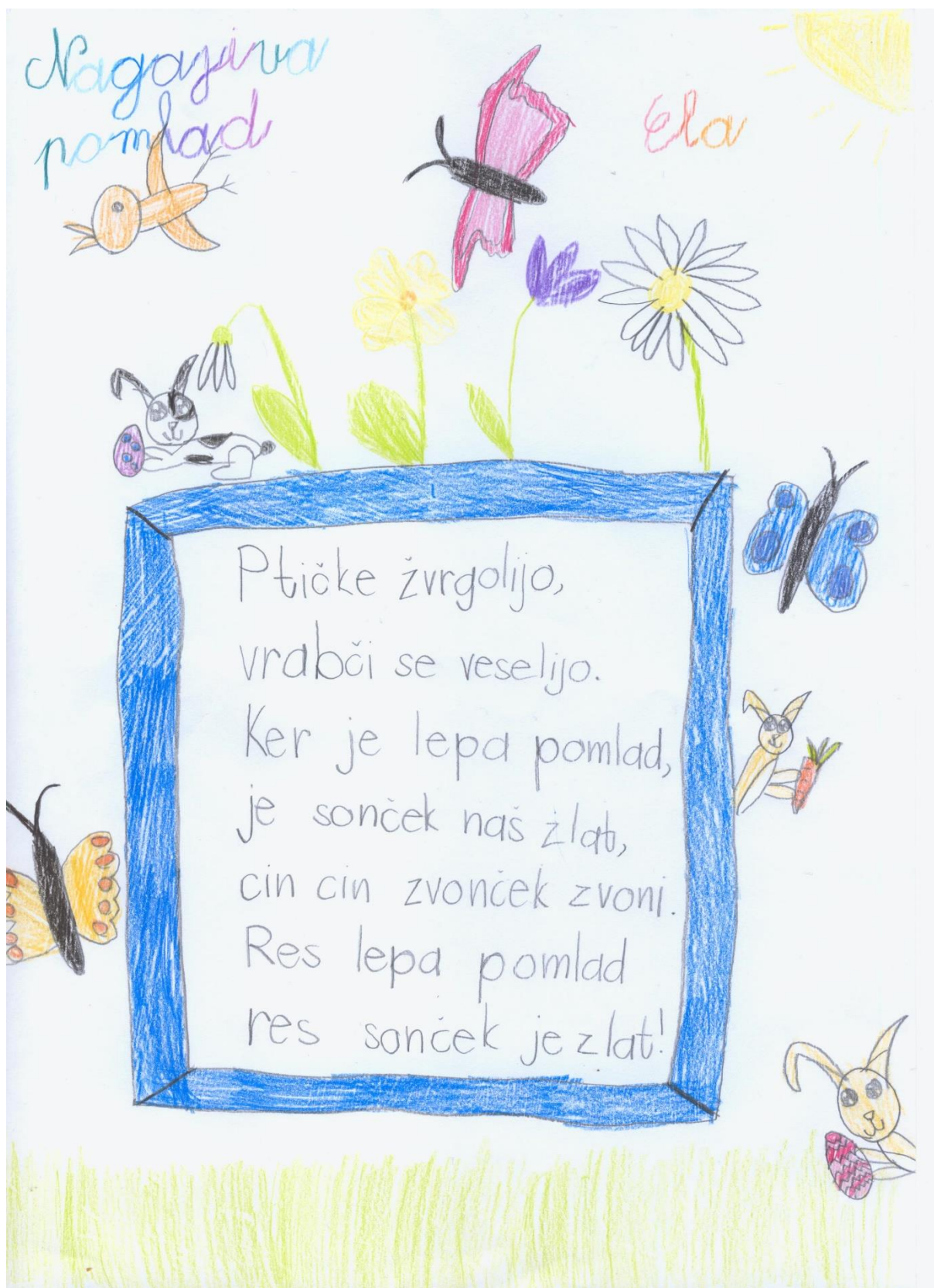
ELA SEDMAK, 2. a