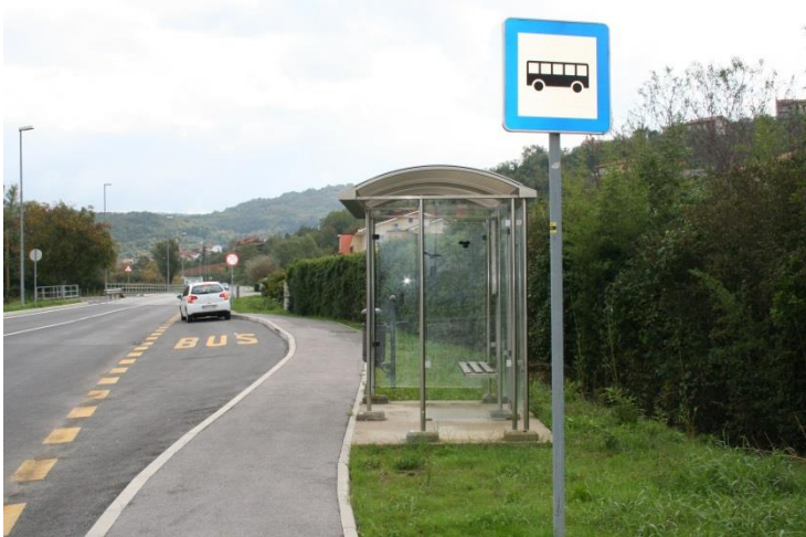
Avtobusna postaja Kampil Novaki