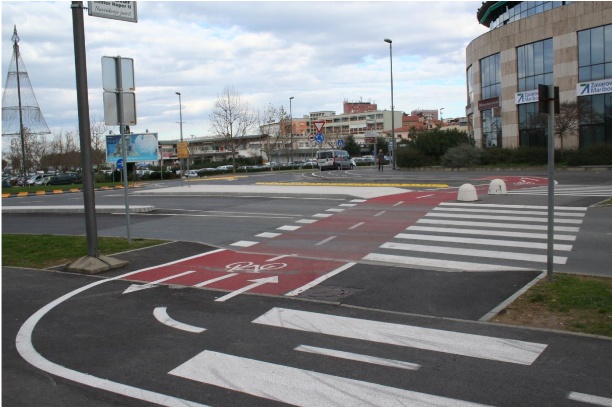
Prehod za pešce pred krožiščem na koncu Ceste Zore Perello-Godina pred Zelenim parkom