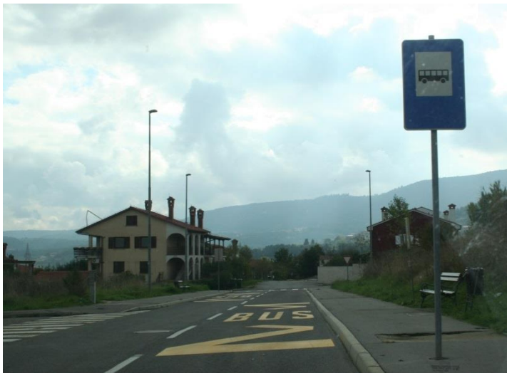
Avtobusna postaja Dolinska – novi bloki za učence 1. do 3. razreda in ostale učence z vozovnico mestnega prometa.