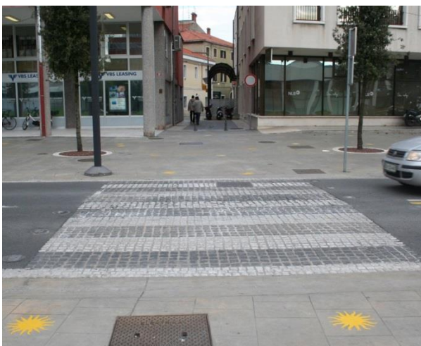
S sončki označena varna pot v šolo iz mestnega jedra.