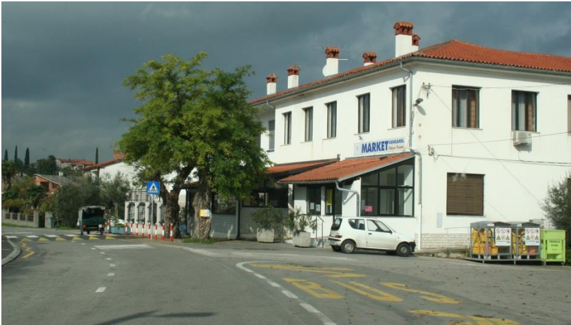
Avtobusna postaja Vanganel