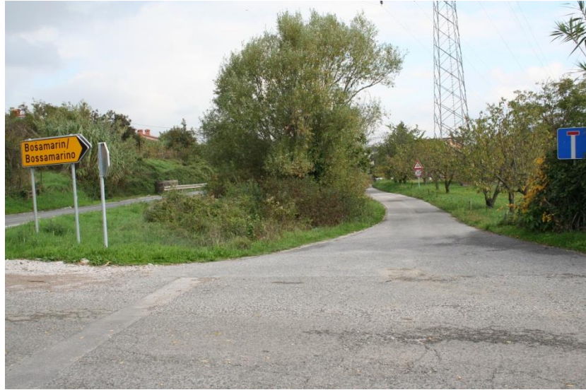
Avtobusna postaja Bošamarin križišče (Dinos)