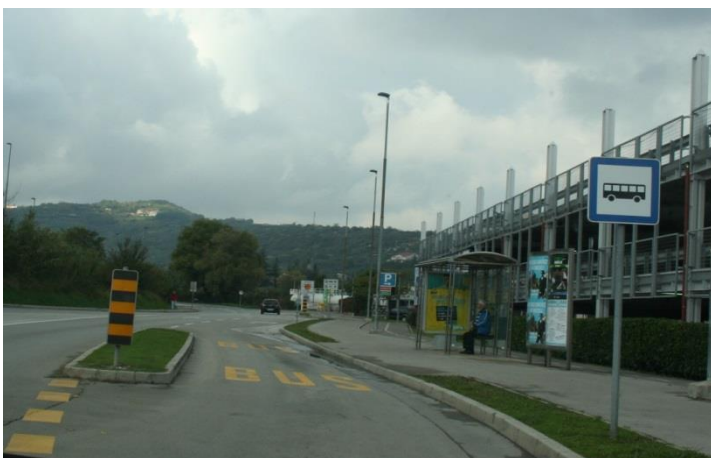
Avtobusna postaja pri Hipermarketu.