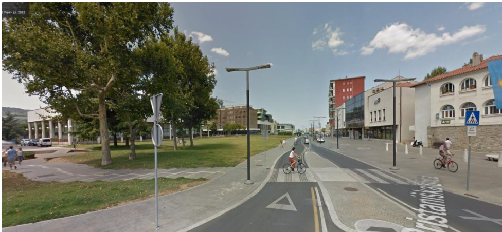
Prehod za pešce pred vrati Muda.