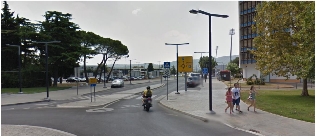
Postajališče za učence z vozovnicami mestnega prometa (za domov) in primestnega prometa.