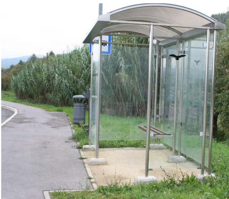
Avtobusna postaja Škarpa