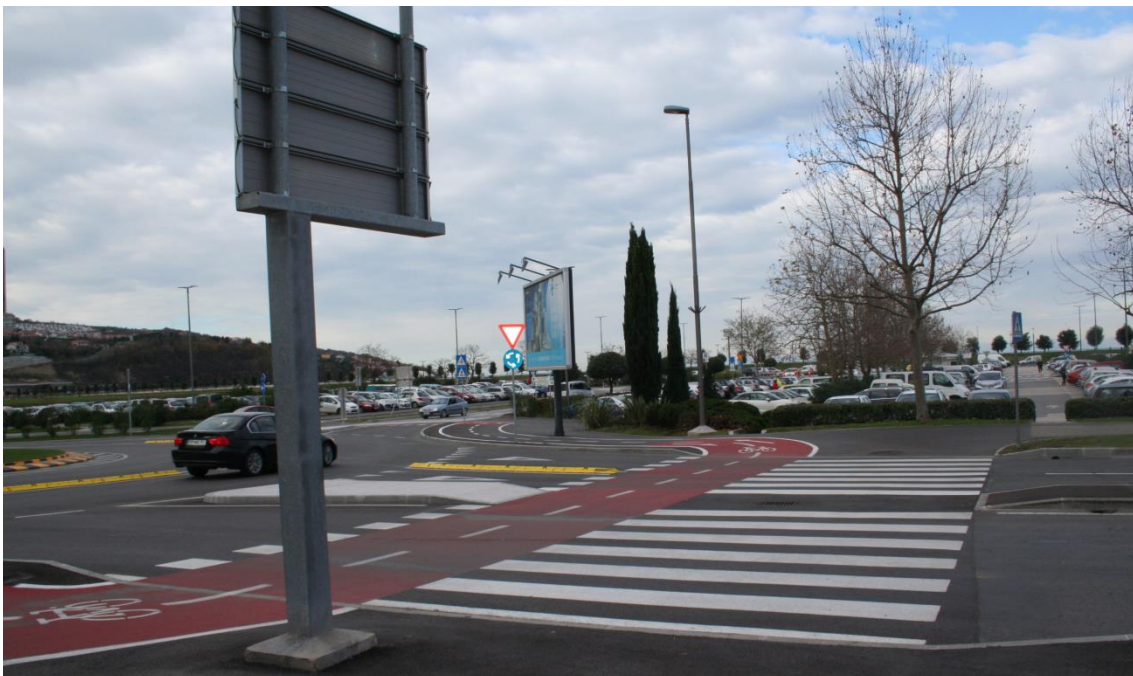
Prehod za pešce na Piranski cesti.