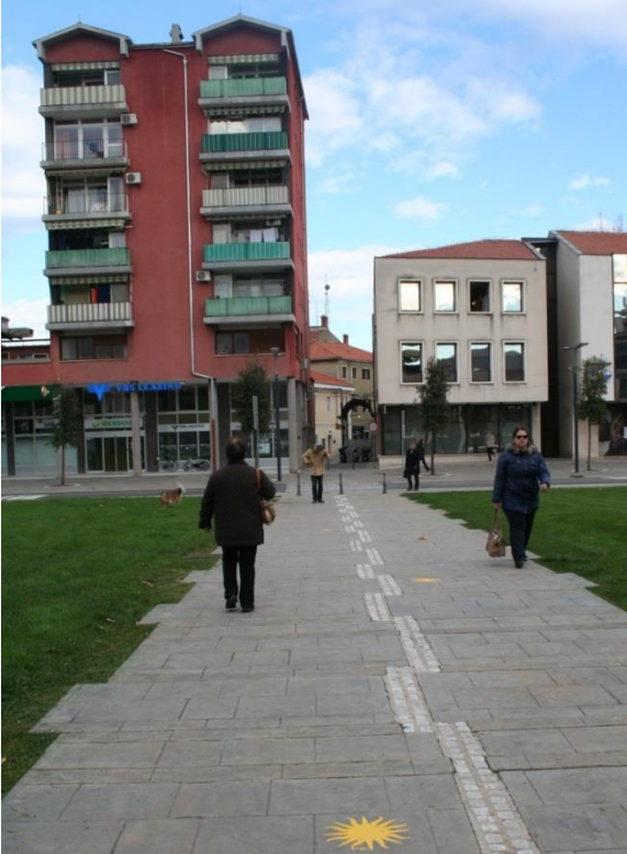
Označena pešpot proti šoli