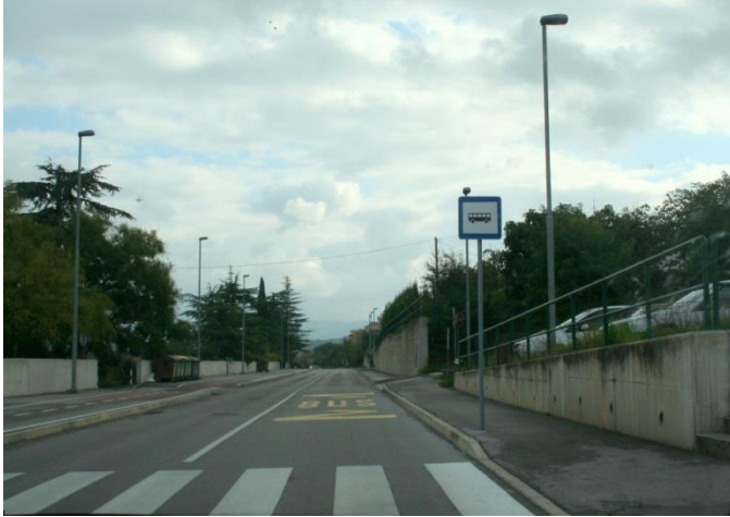
Avtobusna postaja na Dolinski cesti.