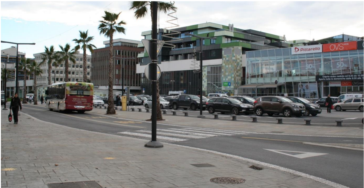
Prehod za pešce na Pristaniški ulici pred staro Sočo