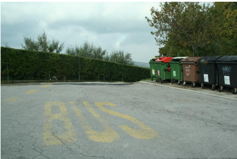
Manžan glavna postaja