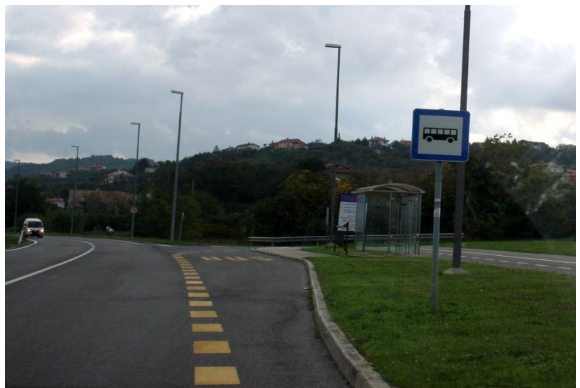
Avtobusna postaja Kampil