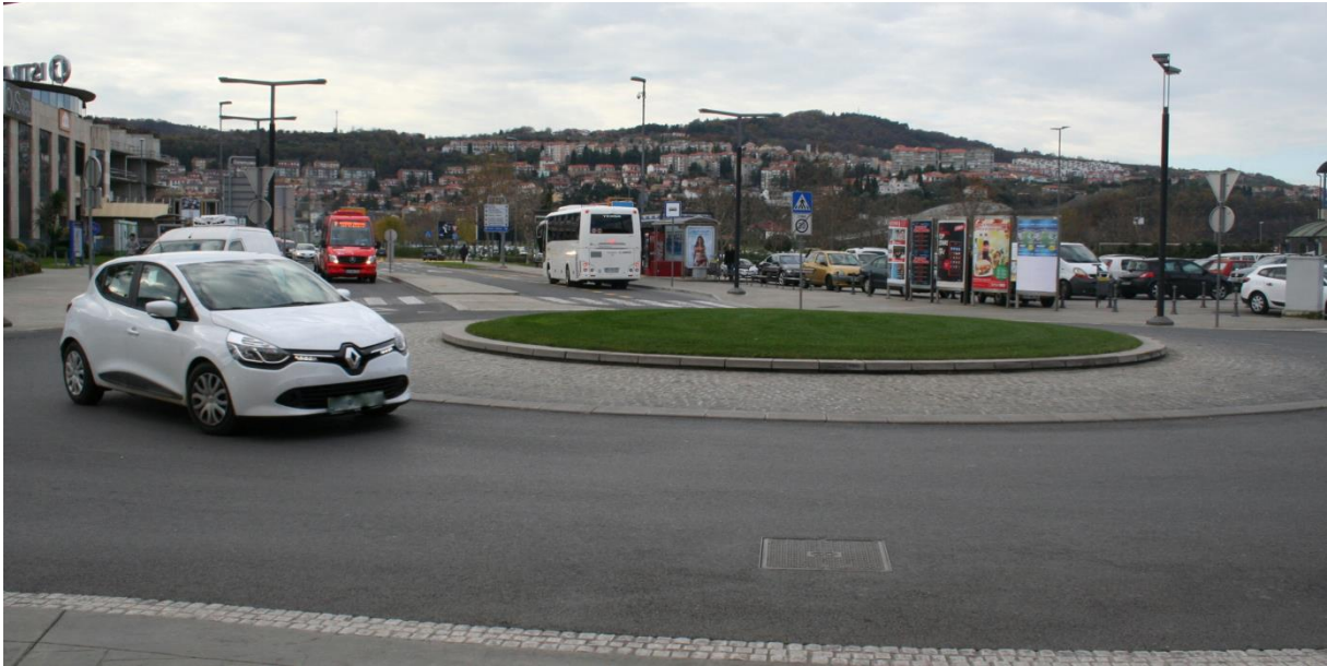
Postajališče za učence z vozovnicami mestnega prometa (zjutraj)