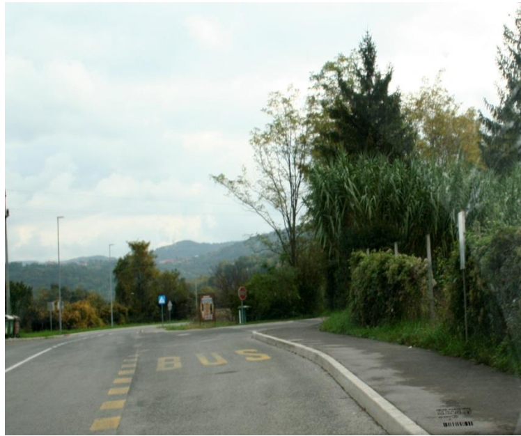
Avtobusna postaja na odcepu za Manžan