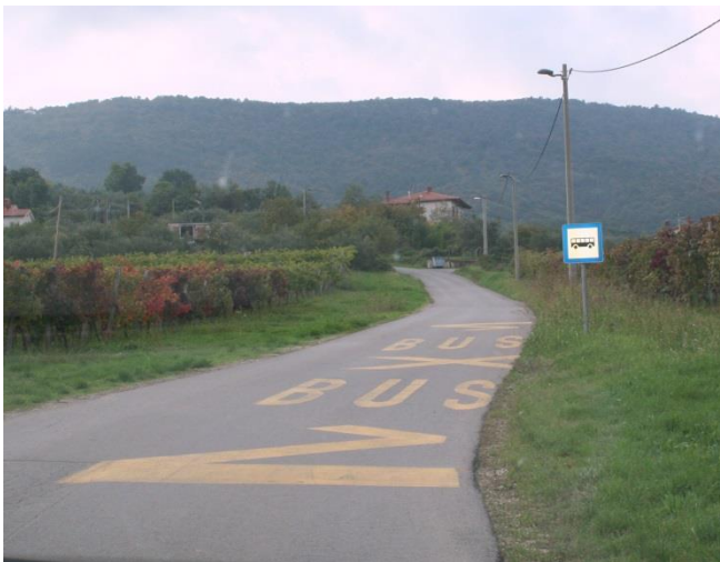
Postajališče na cesti proti Manžanu.