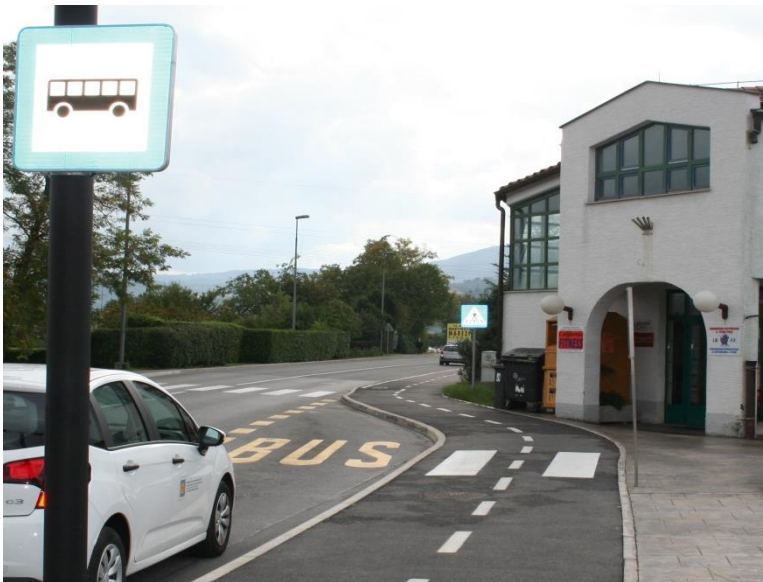
Avtobusna postaja Šalara