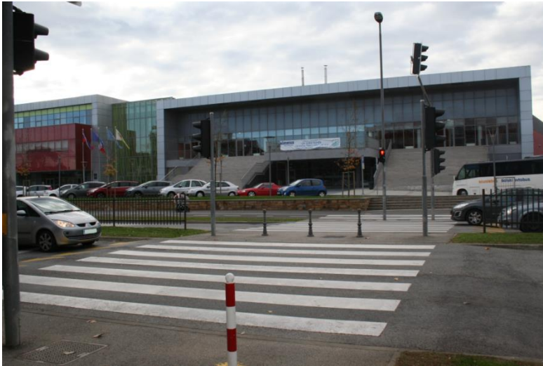
Cesta Zore Perello-Godina – semaforizirani prehod pred šolo