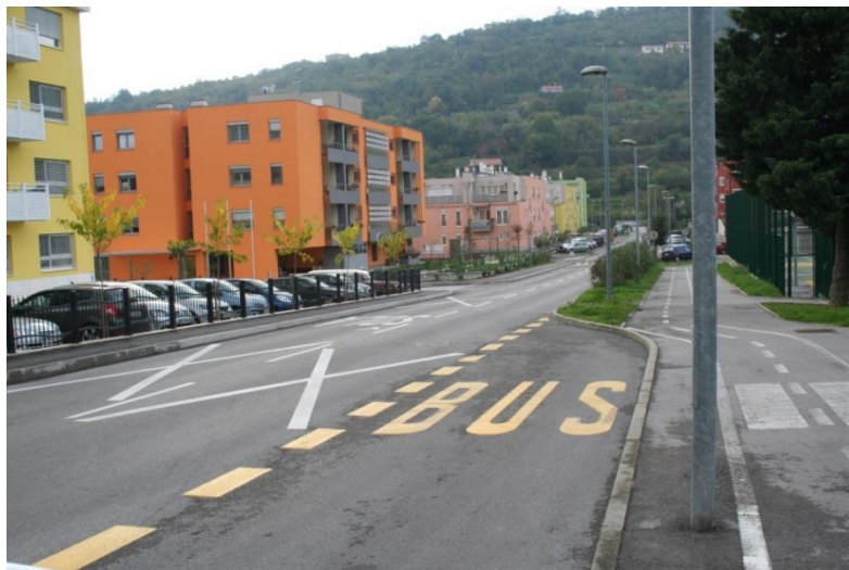
Avtobusna postaja Lantana za učence od 1. do 3. Razreda.