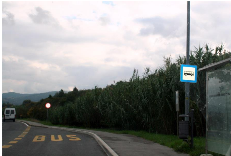
Avtobusna postaja Kampil Brda