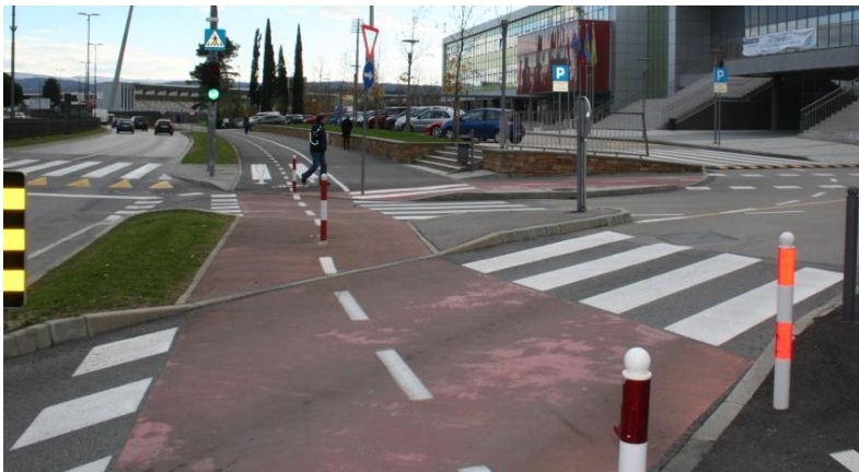
Cesta Zore Perello-Godina –pešpot in kolesarska steza